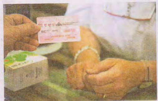
POSITIVO La reforma mejora las deducciones por personas dependientes

«Recogiendo la teoría del premio Nobel Mirrlees, la reforma que recoge el anteproyecto no nos lleva ni a un sistema eficaz ni a una redistribución adecuada»