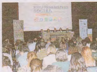
EL BORN El antiguo mercado acogió la Semana de la RSC

Algunas de las muchas empresas que ya han apostado por la RSC en Cataluña aceptaron la invitación de la Semana para explicar sus experiencias en la gestión responsable y certificaron los enormes beneficios que aporta: la diferenciación en